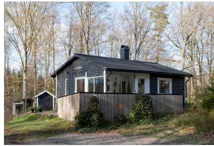
9 883 sommerhuse i Sverige var ejet af danskere i 2022, viser tal fra SCB, Sveriges statistikmyndighed. 12 357 var ejet af nordmænd og 10 787 af tyskere.